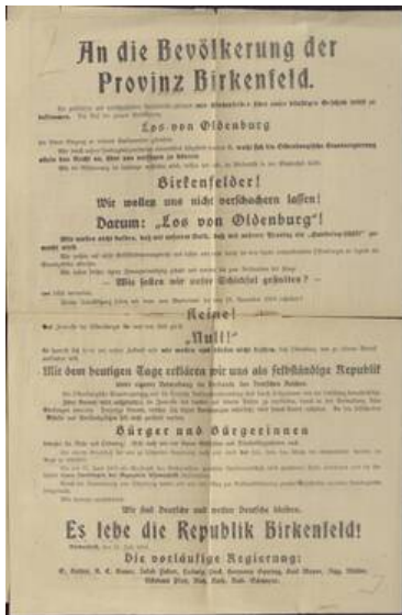
Aufruf der Provisorischen Regierung der Republik Birkenfeld an die Bevölkerung

Die Birkenfelder Geschehnisse müssen selbstverständlich im politischen Zusammenhang des ersten Nachkriegsjahres gesehen werden. Die Aufmerksamkeit, mit der sie in Paris verfolgt werden, scheint eine These zu bestätigen, die sich schon in der älteren Literatur andeutet: Frankreichs Interesse an der Autonomiebewegung zielt darauf ab, in Birkenfeld freie Bahn zu bekommen für die Errichtung eines das gesamte (vorwiegend preußische) linksrheinische Gebiet einschließenden Pufferstaates, nämlich einer Frankreich zugeneigten Rheinischen Republik. Birkenfeld soll sozusagen zu einem „Vorposten französischer Rheinpolitik“ [Anm. 9] gemacht werden. In den vielen Szenarien, die während der Pariser Friedensverhandlungen für die Rheinlandpolitik der maßgeblichen Siegermacht entwickelt wurden, lassen sich vor allem Belege für annexionistische Lösungen finden. Doch es fällt schwer, die französischen Vorstellungen auf einen Nenner zu bringen: Die militärische und politische Führung sind in der Frage nach Art und Umfang der Besetzung heillos zerstritten. Ja, selbst Staatspräsident Poincaré und Regierungschef Clemenceau, der Präsident der Pariser Friedenskonferenz, beantworten sie unterschiedlich.