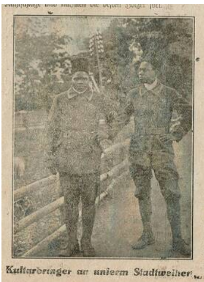
Bild zweier Kolonialsoldaten in Birkenfeld, das mit einer rassistischen Bildunterschrift versehen wurde

Für Otto Baltes hängt die „Birkenfelder Revolution“ untrennbar mit den politischen Umwälzungen gegen Ende des Ersten Weltkrieges und in den ersten Nachkriegsmonaten zusammen. Tatsächlich ist damals nichts zeitgemäßer als die Berufung auf das Selbstbestimmungsrecht der Völker. Hier handelt sich um eine zentrale Forderung im 14-Punkte-Programm des amerikanischen Präsidenten Woodrow Wilson vom Januar 1918, in dem er die Grundzüge einer europäischen Friedensordnung für die Nachkriegszeit entwirft. Die Bildung eines rheinischen „Freistaates“, im Rahmen der anstehenden „Neubildung der Länder“ durch die kommende (am 14. August verkündete) Weimarer Reichsverfassung, erscheint Baltes und seinen Mitstreitern als „einzig gangbarer Weg (...), sich vor der rechts des Rheines her drohenden Schreckensherrschaft der Spartakisten zu schützen“. [Anm. 20] Die Forderung nach Auflösung der Rheinprovinz und der Errichtung eines „von dem undemokratischen Preußen unabhängigen Staates“, weiß Baltes natürlich, kommt den französischen Sicherheitsinteressen entgegen. Sie berechtige aber zu der Hoffnung, damit „vielleicht die harten Bedingungen des kommenden Friedensvertrages mildern zu können“. [Anm. 21]