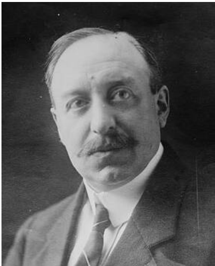
Paul Tirard

Die Causa Birkenfeld, vor allem die von deutscher Seite beklagte mangelnde Neutralität Bastianis, werden zwischen September und Dezember zum Gegenstand eines Notenwechsels zwischen den Regierungen in Paris und Berlin. [Anm. 24] Eine seinen Sicherheitsinteressen zuwiderlaufende preußische Option ist für Frankreich unannehmbar. Es setzt bereits einen im Rahmen einer Verwaltungsreform vorgesehenen Einsatz von Beamten der Rheinprovinz im Birkenfelder Land mit einem de facto-Anschluss an Preußen gleich. Deshalb empfiehlt Paul Tirard, der französische Hochkommissar und Vorsitzende der Hohen Interalliierten Rheinlandkommission in Koblenz, in einem Entwurf für die französische Antwort seiner Regierung, dem preußischen Oberpräsidenten der