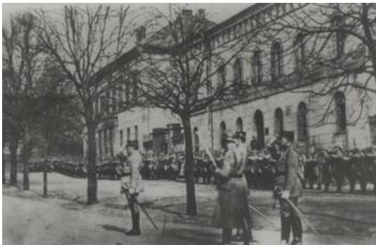
Parade der französischen Besatzungstruppen vor dem Gymnasium in Birkenfeld, 1920

Auch französische Quellen nähren die Vermutung, dass Mangin durchaus eigenmächtig gehandelt und Birkenfeld als einen Testfall betrachtet haben könnte. Seine Kritiker in Generalstab und Politik bemängeln unisono, dass seine heroischen militärischen Qualitäten mit eklatanten persönlichen Schwächen wie Ungestüm und Unbotmäßigkeit gegenüber Vorgesetzten einhergehen. [Anm. 11] „Wenn sich der General auch nach der Unterzeichnung des Versailler Vertrages in der Rheinlandfrage keine Zurückhaltung auferlegt und Autonomiebewegungen weiterhin wohlwollend gegenübersteht, so nicht zuletzt aufgrund eines historisch verklärten patriotischen Sendungsbewusstseins, das er der Einhaltung kurzfristig angelegter politischer Vorgaben aus Paris überordnet. Er sieht sich als Sachwalter eines Franzosen und Rheinländern „gemeinsamen kulturellen Erbes“, das vom Geist der Französischen Revolution geprägt ist. [Anm. 12]