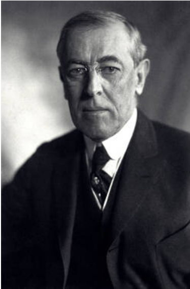
Porträt Woodrow Wilsons

Für Otto Baltes hängt die „Birkenfelder Revolution“ untrennbar mit den politischen Umwälzungen gegen Ende des Ersten Weltkrieges und in den ersten Nachkriegsmonaten zusammen. Tatsächlich ist damals nichts zeitgemäßer als die Berufung auf das Selbstbestimmungsrecht der Völker. Hier handelt sich um eine zentrale Forderung im 14-Punkte-Programm des amerikanischen Präsidenten Woodrow Wilson vom Januar 1918, in dem er die Grundzüge einer europäischen Friedensordnung für die Nachkriegszeit entwirft. Die Bildung eines rheinischen „Freistaates“, im Rahmen der anstehenden „Neubildung der Länder“ durch die kommende (am 14. August verkündete) Weimarer Reichsverfassung, erscheint Baltes und seinen Mitstreitern als „einzig gangbarer Weg (...), sich vor der rechts des Rheines her drohenden Schreckensherrschaft der Spartakisten zu schützen“. [Anm. 20] Die Forderung nach Auflösung der Rheinprovinz und der Errichtung eines „von dem undemokratischen Preußen unabhängigen Staates“, weiß Baltes natürlich, kommt den französischen Sicherheitsinteressen entgegen. Sie berechtige aber zu der Hoffnung, damit „vielleicht die harten Bedingungen des kommenden Friedensvertrages mildern zu können“. [Anm. 21]