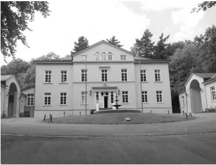
Schloss Birkenfeld