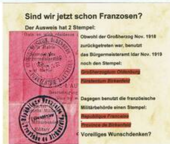
Ausweis der französischen Militärbehörde

Entgegen der Prognose des französischen Militärverwalters polarisiert die Option zugunsten einer organischen Verbindung mit dem Saargebiet in zunehmenden Maße die Autonomie-Bewegung und ist schließlich nicht mehr haltbar. Sie weckt nicht zuletzt Zweifel an der „Reichstreue“ ihrer führenden Akteure. Tatsächlich ist bereits im Vorfeld der Republik-Ausrufung bekannt, dass Deutschland gemäß Art. 45 bis 50 des soeben unterzeichneten Versailler Vertrages die Souveränität über das Saargebiet an den Völkerbund verliert. Eine Anbindung Birkenfelds an das ab 1920 der wirtschaftlichen und politischen Kontrolle Frankreichs unterliegende Saargebiet würde also tatsächlich ein Ausscheiden aus dem Verband des Deutschen Reiches bedeuten. Der Vorwurf des Separatismus wäre gerechtfertigt.