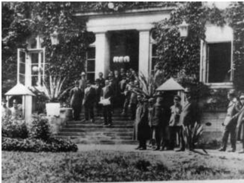
Proklamation der Republik Birkenfeld am 14. Juli 1919 auf der Freitreppe des oldenburgischen Regierungsgebäudes

Am 15. Juli 1919 um 15:40 Uhr lässt das Hauptquartier der X. Französischen Armee in Mainz folgendes Chiffretelegramm an den Vorsitzenden des Obersten Alliierten Kriegsrates, Marschall Ferdinand Foch, abgehen, das zur Weitergabe an den Oberbefehlshaber der französischen Armee, Marschall Philippe Pétain, sowie Staatspräsident Raymond Poincaré bestimmt ist: „Am 14. Juli, um 13 Uhr, ist in Birkenfeld eine Provisorische Regierung gebildet worden, die die Republik ausgerufen und die Loslösung von Oldenburg verkündet hat. Die Bevölkerung bleibt ruhig und schließt sich der Bewegung an. Die Beamten bleiben und versehen weiterhin ihren Dienst. Die Urheber des Staatsstrechs werden sich am Donnerstag der Provinzversammlung vorstellen und sie ersuchen, eine Regierung zu ernennen“. [Anm. 2]