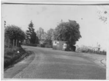
Abb. 8: Das hier fotografierte Zollhäuschen stand am heutigen Kriegerdenkmal.

Während des 2. Weltkrieges kommt es ab 1943 zu Unterbrechungen in der Auslieferung von Paketen. Vermutlich haben Militärgüter Vorrang und zivile Pakete nehmen bei der begrenzten Kapazität der (Post)Züge nur Platz weg. Mit dem Einmarsch der Amerikaner in Rheinbreitbach am 07.03.1945 und der darauf folgenden Trennung in eine französische und eine britische Besatzungszone wird Rheinbreitbach (nicht nur postalisch) von Bad Honnef abgetrennt. Die Grenze der Besatzungszone verläuft dabei am heutigen Kriegerdenkmal, wo ein Wachhäuschen stand. Zahlreiche Geschichten aus dieser Zeit erzählen, mit welchem Einfallsreichtum die damaligen Bewohner Waren und Lebensmittel am Zoll vorbeigeschmuggelt haben. [Anm. 23]