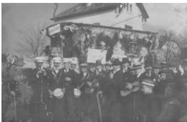
Abb. 6: Im Karneval wurde die elektrische Straßenbahn von Linz nach Bad Honnef bereits gefeiert.