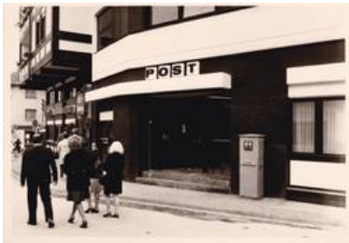
Abb. 9: Die neue Post an der Stelle des ehemaligen Margarethenhofes 1975.