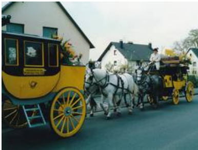
Abb. 2: Postkutsche zur Jubiläumsfeier in Bad Honnef.

Unter der preußischen Herrschaft wurde ab 1819 dienstags und sonnabends eine Postkutsche von Neuwied (Abfahrt 4 Uhr) über Linz und Königswinter nach Bonn eingerichtet. Grund für die Einrichtung dieser Postkutschenverbindung dürfte auf der einen Seite die langsame Verbesserung der Straßen unter preußischer Herrschaft, aber auch eine bessere Federtechnik bei den Kutschwagen sein. Bisher waren die Reisekutschen sehr einfach gebaut, hatten ein offenes Verdeck und Sitze ohne Lehnen. Der Kutscher saß auf einem Kasten, in welchem die Briefe, Wertgegenstände und Pakete aufbewahrt wurden. Ab der französischen Revolution setzten sich dann zunehmend Neuerungen im Wagenbau durch. Leinwandvorhänge schützten die Passagiere vor Regenwetter, Schneegestöber und Sturm und die Sitze wurden mit Polstern ausgestattet.