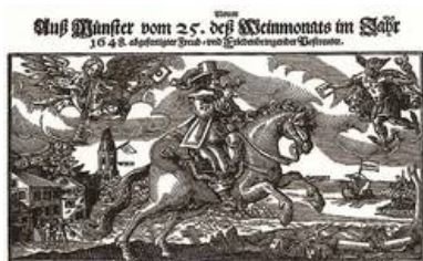
Abb. 1: Postreiter nach dem Dreißigjährigen Krieg

Erst im Spätmittelalter sollten in den Städten sich die ersten (Handels-)Bürger etablieren und das Interesse an einem regeren Handel mit anderen Städten und Wirtschaftsregionen antreiben. Die Übermittlung von wirtschaftlichen Nachrichten sowie Waren wurden immer wichtiger. Die verschiedenen Stände hatten im Mittelalter ihre eigenen Botendienste, um sich von den anderen Ständen abzugrenzen. Somit gab es Universitätsboten, die Boten der Städte und Ämter, des Deutschen Orden oder die Metzgerboten (Viehankäufer). Ein Bote diente dabei häufig nicht nur als Übermittler einer Nachricht, sondern auch als Gesandter mit gewissen Befugnissen.[Anm. 2]