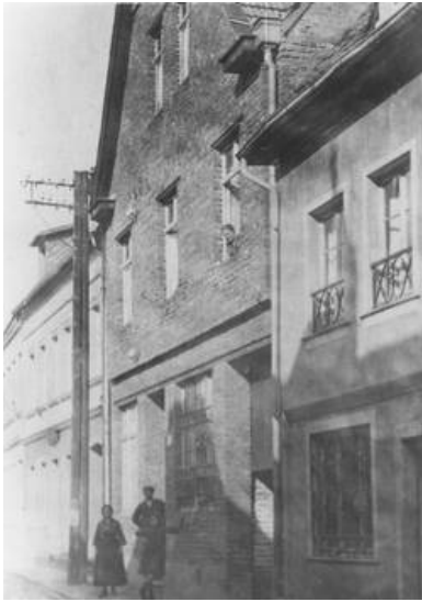
Abb. 5: Neues Postgebäude in der Hauptstraße 18.