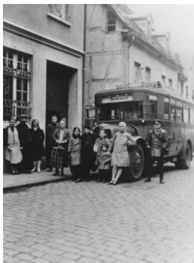
Abb. 7: Kraftpostbus vor der Poststation in der Hauptstraße.

Als die Separatisten das Rheinland vom Reste Deutschlands abspalten wollten, wurden auch die Postbeamten angehalten den Separatisten keine Unterstützung zukommen zu lassen. Gleiches galt in der Zeit des Ruhrkampfes. Die Postagentur Rheinbreitbach bat in dieser Angelegenheit auch um Unterstützung (Hilfsdienst) von Kollegen aus Erpel. Um was für eine Hilfe es sich dabei handelte, lässt sich nicht erschließen.