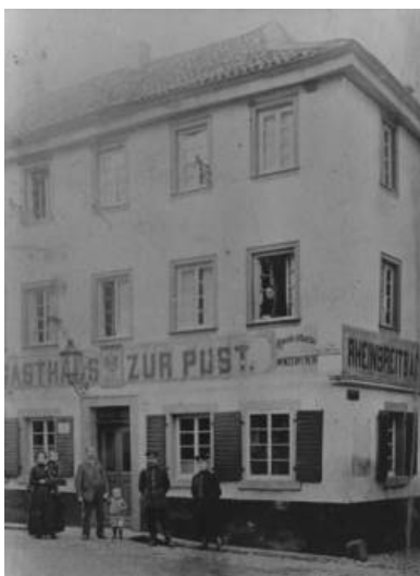
Abb. 3 Gasthaus zur Post in Rheinbreitbach. Erste Postexpedition in Rheinbreitbach.

In dieser Zeit (16.08.1845) wurde die Postzustellung in Rheinbreitbach jedoch noch nicht über den Bahnhof Rolandseck abgewickelt, sondern mit Schubkarren von Linz aus nach Rheinbreitbach geschafft. Am 01.02.1846 wurde in Unkel eine Postexpedition der preußischen Post eingerichtet, die dem Postamt in Bonn unterstellt war. Der Landzusteller nach Rheinbreitbach und Erpel trat seinen Weg nun von Unkel anstatt von Linz aus an. 1847 gibt das Postamt in Bonn bekannt, dass in Unkel eine wöchentliche Landbriefzustellung (an 6 Tagen) für das platte Land eingerichtet wurde. Zwei Jahre später wird bekannt gegeben, dass in Bad Honnef eine Postexpedition errichtet wird, die dem Postbereich in Königswinter untersteht. Mit der Einrichtung der Oberpostdirektion in Koblenz im Jahre 1850 wird die Postexpedition Unkel vom Postamt in Bonn dem in Koblenz unterstellt. Von Koblenz geht auch die Anweisung aus, dass in Rheinbreitbach am 12.08.1852 der erste Briefkasten in Rheinbreitbach aufgestellt wird. Dieser wird täglich um 14 Uhr geleert. Weitere Briefkästen stehen in Leubsdorf (Leerung um 11 Uhr), Rheinbrohl (Leerung um 10 Uhr), Gladbach (Leerung 12 Uhr), Heimbach (Leerung 13 Uhr), Rengsdorf (Leerung 7 Uhr morgens und 6 Uhr), Großmaischeid (Leerung 3-4 Uhr nachmittags), Puderbach (Leerung um 6 Uhr) und Urbach (Leerung um 8:30 Uhr).[Anm. 11]