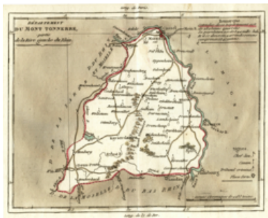
Abb. 2: Karte des Departement Du Mont Tonnerre zu Beginn des 19. Jh. [Bild: ]

Zum Zeitpunkt des Geburtseintrages war das heutige Rheinhessen ein Teil Frankreichs und als Departement Donnersberg (Du Mont Tonnerre) etabliert und in Kantone gegliedert. Sponsheim gehörte zum Kanton Bingen und unterstand der Mairie (Bürgermeisterei) Büdesheim. Im Ort saß ein "Bürgeragent" in der Rolle des Ortsvorstehers mit einem Beigeordneten, der den Titel "Adjunkt" führte.