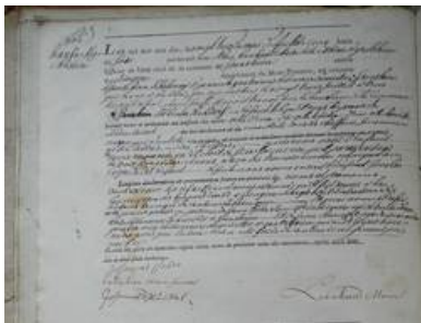
Abb 1.: Geburtseintrag von Christina Hanfacker im Geburtsregister der Gemeinde Grolsheim.

Bei der Digitalisierung des Personenstandsregisters der rheinhessischen Gemeinde Grolsheim fiel der Geburtseintrag Nr. 6 des Jahres 1810 besonders ins Auge: Christina Hanfacker geb. 23.07.1810 – ein Findelkind. Ein nicht alltägliches Ereignis! Es folgte der Entschluss, zu versuchen, den weiteren Lebensweg dieses Findelkindes zu verfolgen. Hierzu sollten in der Hauptsache die Spuren in den heute der Familienforschung zur Verfügung stehenden Internetplattformen genutzt werden.