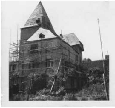
Abb. 5: Die Untere Burg mit Baugerüsten vor dem 2. Weltkrieg.

Trotz der Enteignung im 1. Weltkrieg schienen die Besitzer der Burg in den 1930er Jahren Modernisierungs- und Renovierungsmaßnahmen an der Burg vorzunehmen. Ein Baugerüst wurde aufgestellt und Baumaterial zur Renovierung herbeigeschafft. In dieser Zeit hegten jedoch auch die Nationalsozialisten des Ortes ein reges Interesse an der alten Stammburg derer von Breitbach. Obwohl die Burg im Inneren nur noch von Stahl- und Holzstützen gehalten wurde, fanden hier ab 1933 im sogenannten Rittersaal der Burg einzelne Treffen der Hitlerjugend statt. Ziel war es die Geschichte der Burg für die ideologischen Ziele der Nationalsozialisten fruchtbar zu machen. [Anm. 10]