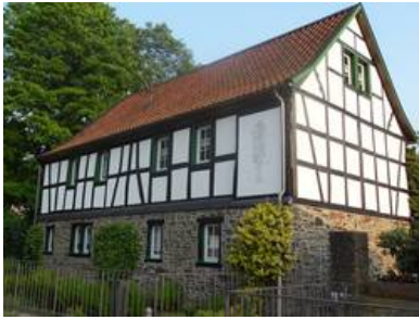
Abb. 8: Das von Privatleuten mühevoll und vorbildlich renovierte Gesindehaus an der Unteren Burg.

Wie jede andere Burg auch, hatte der Burgherr Diener, die für ihn die Arbeiten auf dem Feld und im Haus verrichten mussten. Als Schlafstätte diente diesen dabei das Gesindehaus, welches im Norden der Burg lag und das einzige noch erhaltene Haus der Unteren Burg ist. Es lag wie die Scheune und die Kelterei an der Außenmauer der Burg. Direkt daneben gliederten sich die Ställe und Lagerräume an.