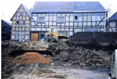
Abb. 7: Die Reste des Weinkellers und der Scheune bei der Verbreiterung der Westerwaldstraße.

Die Scheune der Burg lag in der südwestlichen Ecke der Burgmauer direkt neben dem Burgtor. Es hatte eine Größe von etwa 10m x 6m und diente der Lagerung von Stroh für das Vieh. Sie war im unteren Bereich aus Bruchsteinen gemauert. Der obere Teil war in Fachwerk ausgeführt. Der Grund hierfür lag darin, dass die Scheune Teil der Verteidigungsmauer war.