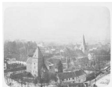
Abb. 2: Die Untere Burg am Fuße des Koppelberges vor

So in etwa dürfen wir uns den ersten Bauabschnitt der Unteren Burg in Rheinbreitbach vorstellen, deren Ergebnis ein einzelner Steinturm auf einem Erdhügel und einem Wassergraben war. Der Turm diente dabei im Falle eines Angriffes als sicherer Rückzugsort und war ein fester Teil des Verteidigungssystems des Dorfes Rheinbreitbach. Doch auch in Friedenszeiten nutzte der Burgherr den Turm als Wohnstätte, worauf die Anbauten am Turm aus späteren Zeiten schließen lassen.[Anm. 1]