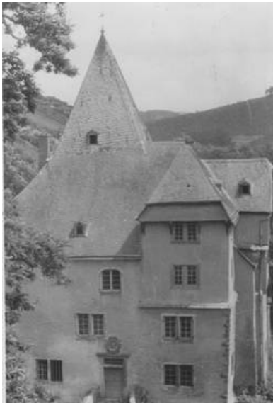
Abb. 3: Blick auf das Wohnhaus der Unteren Burg. Hier lebten die Herren von Breitbach bis 1473, Foto von 1920

Durch die kluge und geschickte Politik der Herren von Breitbach wuchs deren Macht, Reichtum und Einfluss innerhalb Kurkölns und der katholischen Kirche rasch an. Das Adelsgeschlecht wurde mit hohen Ämtern betraut und wollte sich dementsprechend auch an seinem Stammsitz in Rheinbreitbach