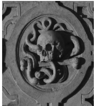
Kartusche mit Totenschädel und Knochen (Nr. 3)

Aus dem Vorgängerbau ist lediglich die aus dem 3. Viertel des 14. Jahrhunderts stammende Glocke sowie die Grabplatte des 1439 verstorbenen Pfarrers Johannes von Robur (Nr. 2), die im Barock als Mensaplatte des Hochaltares Verwendung fand, erhalten geblieben. Mit den wechselnden Bekenntnissen wurde jeweils auch die Inneneinrichtung der Kirche verändert. So erfolgte mit der Einführung der Reformation 1557 durch Herzog Friedrich II. von Pfalz-Simmern in der zweiten Hälfte des 16. Jahrhunderts der Einbau der Emporen und der Abbruch der Außenkanzel. Die um 1490/1500 entstandene gotische Steinkanzel wurde dagegen nach einigen Veränderungen nur neu platziert. Im Dreißigjährigen Krieg erzwangen die spanischen Soldaten wieder den katholischen Kult. Feierte man zunächst den katholischen Gottesdienst noch im Hause des badischen Truchsessens, so konnte seit der französischen Besatzung die Kirche gemeinsam mit den Evangelischen genutzt werden. Aus dem 16. und 17. Jahrhundert haben sich nur noch sehr wenige Grabdenkmäler erhalten, die aber dennoch die ehemalige Bedeutung Kirchbergs als Amt- und Verwaltungsstadt widerspie-