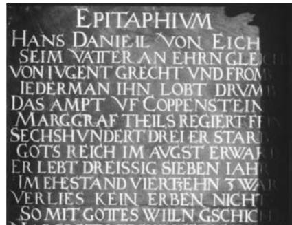
Epitaph des Daniel von Eich (Nr. 7)

Die klassischen Kapitalisformen und ihre charakteristischen Merkmale werden erst in der Renaissancekapitalis wieder aufgegriffen. Diese jüngeren Kapitalisschriften des 15. bis 17. Jahrhunderts weisen nur in seltenen Fällen die strengen Konstruktionsprinzipien der antiken Kapitalis auf. Sie kommen in vielfältigen Erscheinungsformen vor, z.B. mit schmalen hohen Buchstaben oder als schrägliegende Schriften.