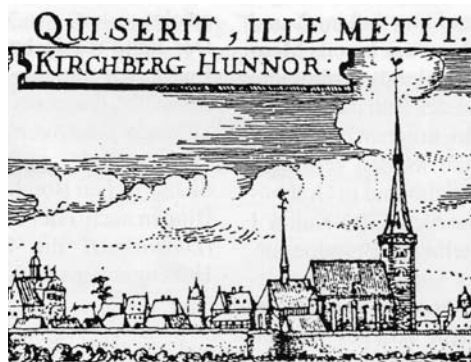
Stadtansicht von Norden, Kupferstich 1623-31

Fragmenten von dem Restaurator in mühsamer Arbeit zusammengesetzt werden konnte. Eine große Hilfe bildete dabei die um 1765 von dem damaligen Pfarrer gemachten Aufzeichnungen im Würdtweinschen Epitaphienbuch. So konnte auch das Hosingen-Epitaph (Nr. 3) restauriert werden, das – auch über den Hunsrück hinaus – zu den bedeutenden Werken der deutschen Renaissance gerechnet werden darf.