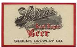
Werbung der Siebens Brauerei in Ebersheim