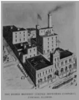
Siebens Brauerei in Ebersheim