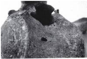
Abb. 6: Die Pfeilspitze steckt im Wirbel eines Hirsches

Die Stücke variieren zwar stark in Größe und Gestaltung ihrer Basen, allen gemeinsam sind jedoch die mehr oder weniger deutlich ausgeprägten seitlich liegenden Heftkerben. (Anm. 9) Die der Sprendlinger Pfeilspitze am nächsten gelegenen Vergleichsstücke haben wie sie eine ausgebauchte Basis und verteilen sich rechtsrheinisch vom Mittelrhein bis zum Bodensee. (Anm. 10) Ihre Datierungen reichen momentan von glockenbecherzeitlich (Alsfeld, Kopisty) und endneolithisch (Maurach) bis zur Bronzezeit Stufe D (Reichertshausen). Zieht man weitere Vergleichsstücke mit gerader Basis heran, so lassen sich zwar besonders im Endneolithikum und der frühen Metallzeit Häufungen feststellen, die große zeitliche Spanne, über die diese Pfeilspitzen anscheinend auftreten können, findet jedoch keine stärkere Eingrenzung. Nach dem heutigen Forschungsstand stammt das älteste Fundstück dieses Spitzentyps aus dem Wartberg-Horizont (Güntersberg), und die jüngsten Vertreter kommen aus bronzezeitlichen Fundzusammenhängen. (Anm. 11)