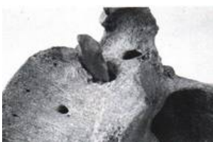
Abb. 5 Gerena (Prov. Sevilla)

Nachdem geklärt werden konnte, dass es sich bei der Pfeilspitze und dem Knochen um einen geschlossenen Fund handelt, stellt sich nun die Frage nach dessen Alter. Da sich, wie oben beschrieben, die Beifunde nicht mehr rekonstruieren ließen, und eine 14C-Beprobung nicht möglich war, ist man auf den typologischen Vergleich bereits datierter Stücke angewiesen. Durch ihre markanten Heftkerben ähnelt die Pfeilspitze auf den ersten Blick solchen vom amerikanischen Kontinent (Anm. 8), hat aber ebenso vereinzelt Parallelen im ausgehenden Neolithikum Mitteleuropas sowie in den frühesten Metallzeiten Süd- und Westeuropas. Ein eingehendes Literaturstudium sowie Nachforschungen in öffentlichen und privaten Sammlungen erbrachten auch aus der näheren Umgebung eine so große Menge vergleichbarer Stücke (vgl. die Liste und Abb. 7-9), dass von der Annahme einer amerikanischen "Einfuhr" gänzlich abgesehen wurde.