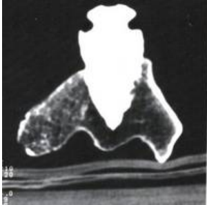
Abb.4 Computertomographische Schichtaufnahme

strahlendichteren Randsaum anschließt (Abb. 4). Dieser Befund ist als eine entzündliche Lysezone um das Projektil mit beginnender Regeneration des Knochens vom Randsaum her zu interpretieren. (Anm. 5) Die Dichtemessungen des Knochens ergaben im Lysebereich einen Wert von -850 HE (Hounsfield Einheiten), im Bereich der erhaltenen Kortikalis von -500 HE und im Bereich der Steinspitze von +1900 HE. (Anm. 6) Der niedrige Dichtewert in unmittelbarer Nähe der Geschosßspitze ist vergleichbar mit Lungengewebe und durch eine entzündliche Demineralisation des Wundbereichs entstanden.