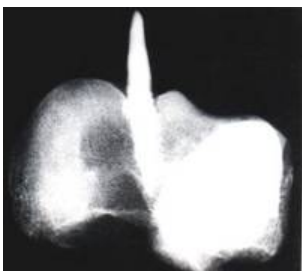
Abb.3 Radiologische Aufnahme in der Achse der Spitze

Die radiologische Aufnahme des Knochens, in der Achse der Spitze aufgenommen (Abb. 3), zeigt, dass die Spongiosa im Kontaktbereich zwischen Stein und Knochen Verdichtungszone aufweist, wie sie nach überstandener Verletzung durch Knochenregeneration entstehen. (Anm. 4) Bei einem jugendlichen Tier ist dies in einer Zeitspanne von vier bis sechs Wochen zu erwarten, was den ersten Eindruck dieses Fundstückes bestätigt. Die computertomographischen Schichtaufnahmen, die in einer Schichtdicke von einem Millimeter erfolgten, stellen die intakte Pfeilspitze in engem Kontakt zum umgebenden Knochen dar, wobei sich um den eingedrungenen Stein eine Zone größerer Transparenz mit einem