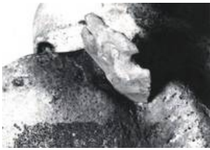
Abb.2 Knochenneubildung am Einschusskanal