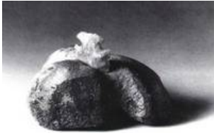
Abb.1 Lateralansicht der Epiphyse mit Geschosspitze

von Christian Humburg, Sabine Lindig und Arun Banerjee