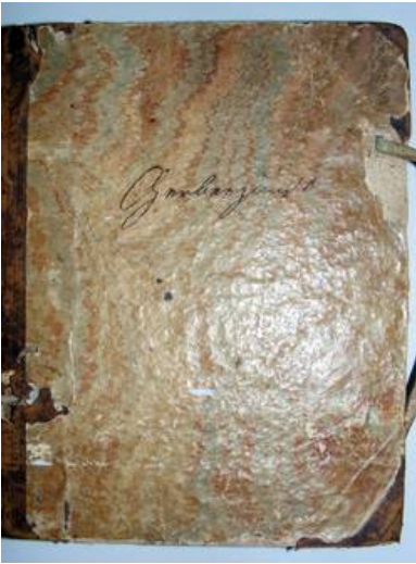
Einband des Zunftbuches von