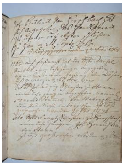
Auszug aus dem Zunftbuch.

Im Hachenburger Stadtarchiv befindet sich ein altes Zunftbuch.[Anm. 7] Ein kleines Buch, das etwa der Größe DIN A5 entspricht, die Schrift teilweise verblichen und schlecht zu lesen, das irgendwo in der Mitte beginnt, aber voller Überraschungen steckt. Die Vereinbarungen der Gerber wurden wie folgt festgehalten: