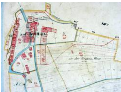
Auszug aus Katasterkarte mit Lage der Lohmühle. Von mir ergänzt: 417,418 bis 423.

1802.1? ten Mertz hat peter Elias Auen von ham Einen lohr Jungen laßen aufdingen Henrich Auen muß stehen zwey jahr