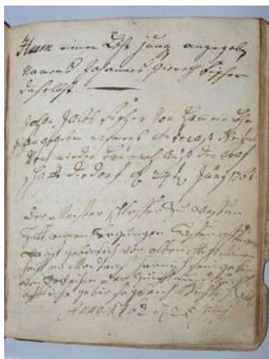
Auszug aus dem Zunftbuch.