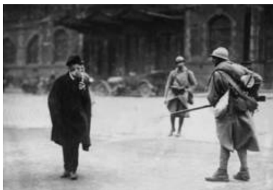
Französische Militärs während des Ruhrkampfes.