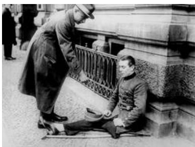
Berlin bettelnder Kriegsinvalide[Bild:

Die Bewohner der linken Rheinseite waren im Laufe der vier Kriegsjahre bereits schweren Belastungen ausgesetzt gewesen und mussten sich nun widerwillig diesen harten Friedensbedingungen unterordnen, obwohl sie sich anfangs keineswegs als Kriegsverlierer, geschweige denn Schuldiger, verstanden. Im Gegenteil: In Mainz beispielsweise bereitete man den zurückkehrenden Truppen in den ersten Dezembertagen einen ehrenvollen Empfang.[Anm. 16] Sie sahen sich folglich auf zweierlei Weise gedemütigt: Zum einen mussten sie kaum realisierbare Friedensbedingung und die alleinige Kriegsschuld akzeptieren, zum anderen war man dazu gezwungen, den Initiator dieser Misere, Frankreich, in der eigenen Heimat als neue Führung zu dulden und sich dem einstigen "Erbfeind" zu unterwerfen.