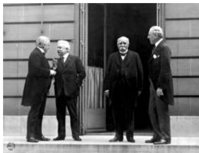
von links: David Lloyd George, Vittorio Emanuele Orlando, Georges Clemenceau, Woodrow Wilson.