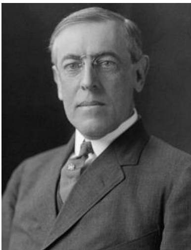
Thomas Woodrow Wilson (* 1856 □1924)