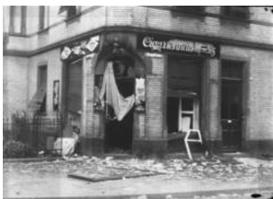
Ein 1930 vollständig zerstörte Zigarrengeschäft eines Separatisten in der Boppstraße in Mainz.

Mit dem Versailler Vertrag, der unter Ausschluss Deutschlands maßgeblich vom „Rat der Vier“[Anm. 13] bestimmt wurde, wurden der deutschen Bevölkerung schwerwiegende Lasten aufgebürdet. Zu der Anwesenheit ausländischer Truppen im Reich kamen weitreichende Gebietsabtretungen,[Anm. 14] eine umfassende Abrüstung und immens hohe Reparationszahlungen.[Anm. 15] Am folgenschwersten traf die Menschen aber der sogenannte Kriegsschuldartikel. Eine Klausel innerhalb des Vertrags, die besagte, „dass Deutschland und seine Verbündeten als Urheber aller Verluste und aller Schäden verantwortlich sind, welche die alliierten und assoziierten Regierungen und ihre Angehörigen infolge des ihnen durch den Angriff Deutschlands und seiner Verbündeten aufgezwungenen Krieges erlitten haben“ . Offiziell nahm das Deutsche Reich bei der Unterzeichnung am 28. Juni 1919 somit die alleinige Schuld am Ersten Weltkrieg auf sich.