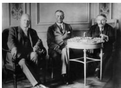
Die Beratungen in Locarno: Briand mit dem deutschen Außenminister Stresemann und dem englischen Außenminister Chamberlain.

Eine kurzfristige Veränderung des angespannten Verhältnisses zwischen Deutschland und Frankreich erfolgte im Oktober 1925 mit den Verträgen von Locarno. Auf Initiative des deutschen Außenministers Gustav Stresemann und seines französischen Amtskollegens Aristide Briand bewirkten die am 10.