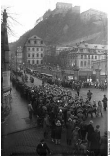
Der Abzug aus Koblenz.