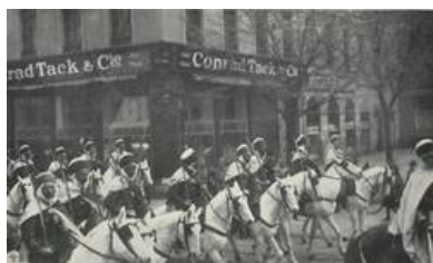
Aus Tunesien stammende Soldaten in Mainz. [Bild: Heinrich Wothe/Rheinischer Heimatverein Mainz e.V.] [Bild: Heinrich Wothe/Rheinischer Heimatverein Mainz e.V.]

Im Gegensatz dazu wurden in Worms nachts schwarze Listen ausgehängt, damit diejenigen, „die offenkundig mit den Besatzungsangehörigen in Beziehung standen [...] öffentlich gebrandmarkt werden.“ [Anm. 33] Diese Demütigungen bezogen sich insbesondere auf „schamlose Frauenzimmer“ [Anm. 34], die „mit den Franzosen in Verkehr“ getreten waren und Kinder geboren hatten, die in der Besatzungszeit als sogenannte Utschebebbes beschimpft wurden. Dementsprechend liest man 1930 in der rheinhessischen Chronik: „Die traurigsten Folgeerscheinungen dieses Entgegenkommens treten als krausköpfige, schwarze Kinder in Erscheinung.“ [Anm. 35] Alles in allem gilt dieses in der Zwischenkriegszeit verbreitete Bild des wilden, französischen Soldaten heute als weitgehend