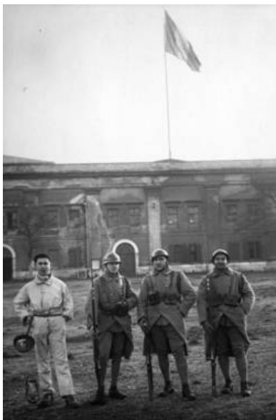
Die französische Fahnenwache auf der Festung Ehrenbreitstein.

Durch die auch in der amerikanischen Zone wirksame Pressezensur erschien ab 1919 die amerikanische Tageszeitung „The Amaroc News.“ Sie diente in erster Linie als Informationsquelle für die amerikanischen Soldaten, lässt jedoch auch das Bestreben erkennen, ein freundschaftliches Verhältnis zur deutschen Bevölkerung aufzubauen. So wurden beispielsweise auch deutsche Leserbriefe, Gedichte und Werbung für ortsansässige Geschäfte abgedruckt.[Anm. 41] Wie bereits exemplarisch aus Worms berichtet, ging auch hier das Verhältnis zwischen Besatzern und Besetzten oftmals über diese freundschaftlichen Beziehungen hinaus: 1.851 amerikanisch-deutsche Kinder, zu deren Absicherung 1925 eigens eine Stiftung eingerichtet wurde, zählte man am Ende der amerikanischen Besatzungsphase. Gesuchen der Amerikaner, ihre deutschen Liebhaften heiraten und mit in die USA nehmen zu dürfen, wurde unter bestimmten Umständen ebenfalls stattgegeben.[Anm. 42] Vor diesem Hintergrund wurde der Abzug der letzten 1.200 an Rhein und Mosel stationierten Soldaten der American Forces in Germany (AFG) und die Ankunft des französischen Militärs im Januar 1923 von vielen Einwohnern als Verschlechterung wahrgenommen.