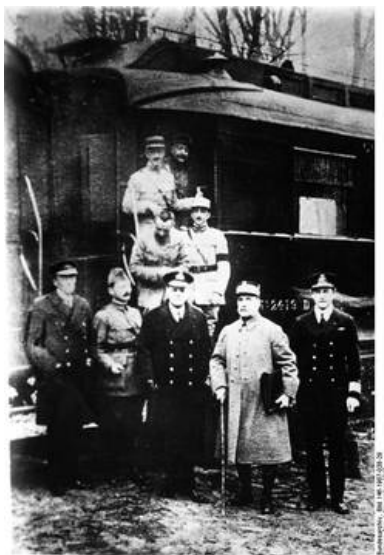
Marschall Foch und andere französische Generäle vor einem Salonwagen in Compiègne.