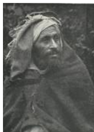
Soldat der tunesischen Kavallerie.

Auf deutscher Seite trat man diesen Versuchen französischer Kulturpolitik der pénétration pacifique [Anm. 23] meist mit Argwohn entgegen. Vielfach kursierten sogar Gerüchte von französischen Kolonialsoldaten, die Gewalttaten begingen und im Rheinland ihr Unwesen trieben.