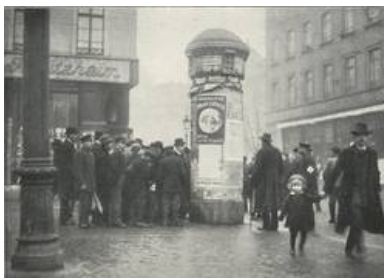
Die Mainzer Bevölkerung liest die ersten

Die Stationierung amerikanischer, französischer, belgischer und britischer Truppen auf der linken Rheinseite, auf einigen Brückenköpfen rechts des Rheins und eine etwa 10 Kilometer lange entmilitarisierte Zone war bereits im Waffenstillstandsabkommen vorgesehen und begann in Mainz Anfang Dezember mit der Ankunft des Generals Charles Marie Emmanuel Mangin.[Anm. 2]