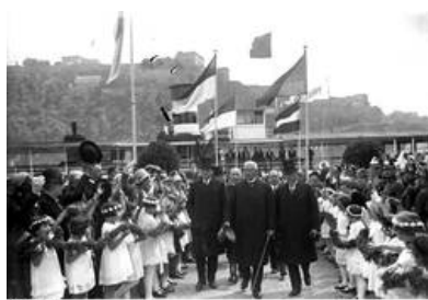
Reichspräsident Hindenburg und Ministerpräsident Otto Braun zur Feier anlässlich des Endes der alliierten Besetzung des Rheinlands in Koblenz am 22. Juli 1930.