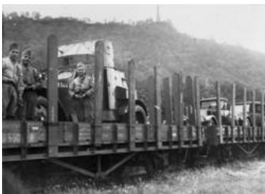
Französische Soldaten verlassen Trier.