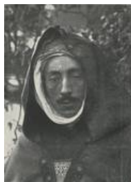
Offizier des algerischen Regiments.