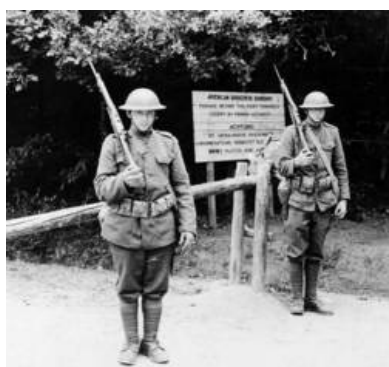
Zwei amerikanische Soldaten an der Grenze zum amerikanisch besetzten Brückenkopf bei Montabaur, 1919

Während in Rheinhessen bereits der Mythos des gewalttätigen französischen Kolonialsoldaten aufkeimte, waren die Gebiete um Trier und Koblenz noch amerikanisch besetzt. Die Stationierung von bis zu 250.000 Soldaten der US-Army wurde von Major General Henry T. Allens von Koblenz aus geleitet und dauerte von November 1918 bis Januar 1923 an.[Anm. 37] Anders als in Rheinhessen lässt sich hier rückblickend ein im Großen und Ganzen friedliches Zusammenleben von Amerikanern und Deutschen feststellen, das von vielen Zeitgenossen im Vergleich zur anschließenden französischen Besatzungszeit aufgewertet wurde.[Anm. 38]